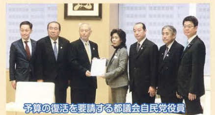
▲予算の復活を要請する都議会自民党役員

その結果、都議会自民党の要請が全面的に反映され、一般会計約200億円が、27年度予算に復活して計上されました。