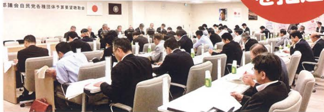
▲各種団体の皆様からの要望について意見交換する都議会自民党議員団