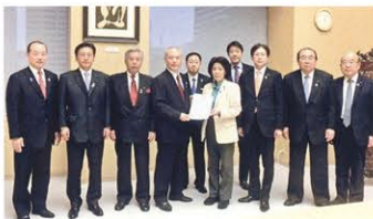
▲政策提言する政策推進総本部役員

各種団体の皆様から 予算要望を伺いました 27年度予算編成に向け、 各種団体の皆様から要望を 伺う「予算要望聴取会」を 昨年9月に開催しました。 今回も7日間におよぶ日 程となり、福祉、教育、医 療、環境、建設、運輸、商 業、工業、農林、食品など の各種団体の皆様から切実 な要望を賜りました。 都議会自民党は皆様の要 望の実現へ向け、予算編成 に取り組みました。