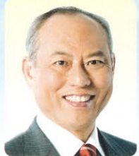
舩添要一 新都知事