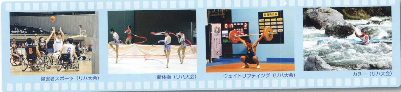
障害者スポーツ (リハ大会)