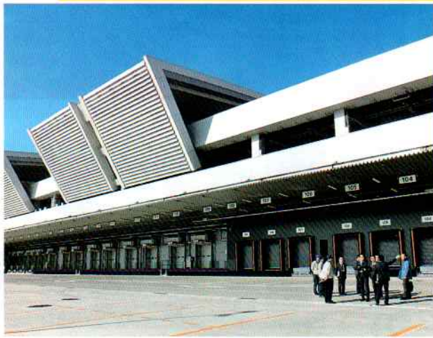
豊洲市場を視察する都議会自民党議員団