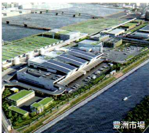
豊洲市場

応急処置の整備ではいすれ破綻 このままでは、今後30年のうちに70%以上の確率で発生するといわれる、