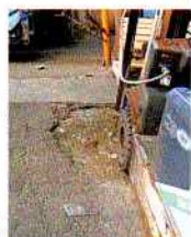
築地市場内のアスファルトの亀裂

豊洲は科学的、法的にも安全 一方、豊洲市場は、築地市場が抱えるこれらの問題をクリアできるようにつくられた施設ですから、知事も都の各関係局長も明らかにしているように、科学的にも法的にも安全は確認されています。