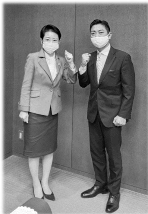
来夏に向けてWガッツポーズ！

昨今、第3波と呼ばれる新型コロナウイルス感染症が国内全体に拡大し、足立区も例外ではない状況が続いております。これから年末年始を迎えるにあたり、インフルエンザ対策だけでなく、家庭内での消毒や換気、外出時の感染予防にも留意する事、基本的な防衛策をとりながらの経済活動も重要であるとともに足立区内での感染を食い止める施策等、有意義な対談の時間をいただきました。